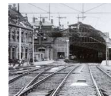
Het historische Postdistributie Centrum, 1938